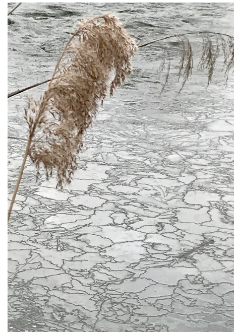
T. Feldschuh: Winter am Mühlwasser, 2023